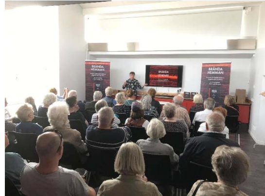
Foton från projektinvigningen den 18/5 – 2019.

Invigningen inkluderade bland annat följande: