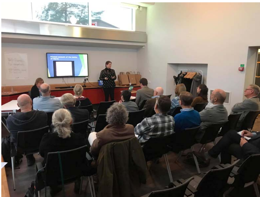
Foto från seminariet 21/11 – 2019.

Utöver ovanstående program bekostade projektet förmiddagsfika, eftermiddagsfika samt en avslutande middag på restaurang Saltsjö Pir för samtliga föreläsare och åhörare. En visning av museet HAMN erbjöds deltagarna. Totalt deltog omkring 40 personer.