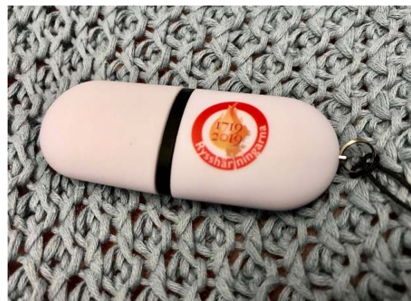
Rollups och USB-minnet från utställningen.