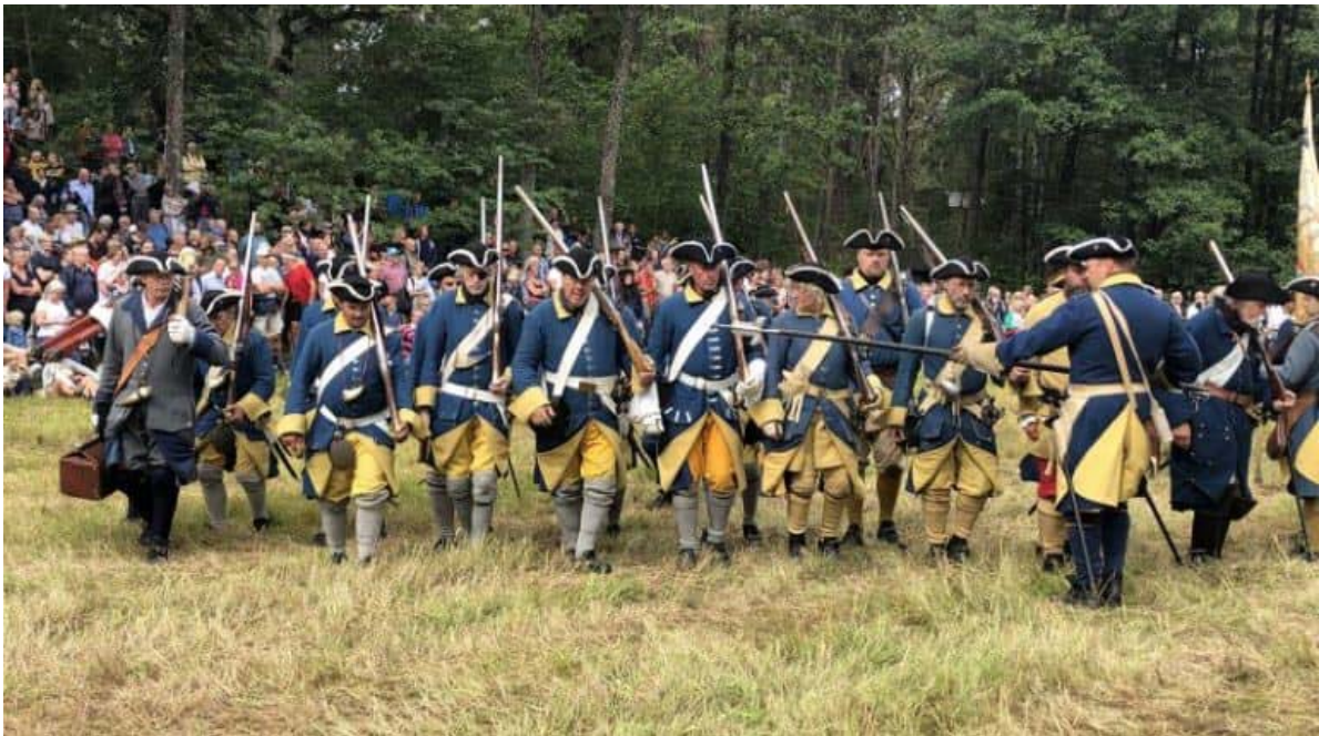
Foto från minnesdagarna för slaget vid Stäket 13/8 – 2019.